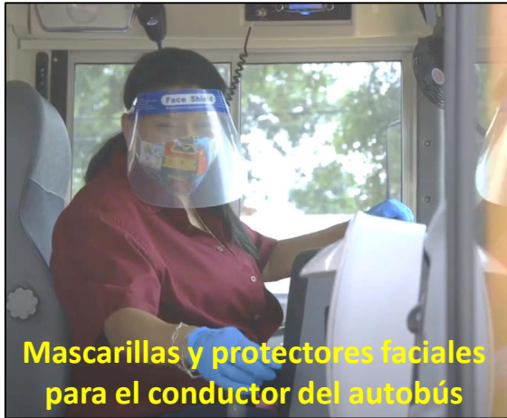
Mascarillas y protectores faciales para el conductor del autobús