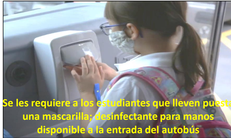
Se les requiere a los estudiantes que lleven puesta una mascarilla; desinfectante para manos disponible a la entrada del autobús