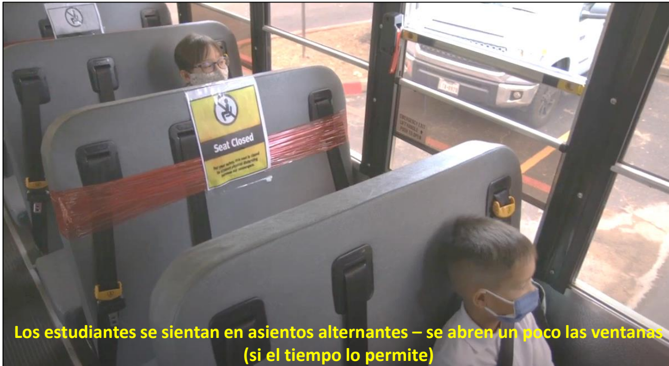
Los estudiantes se sientan en asientos alternantes – se abren un poco las ventanas (si el tiempo lo permite)