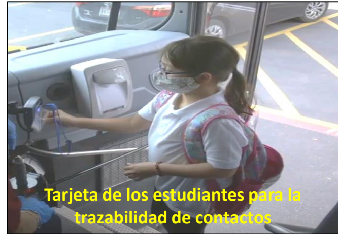
Tarjeta de los estudiantes para la trazabilidad de contactos