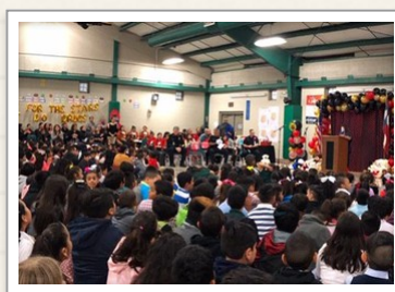
Care Bear Assembly