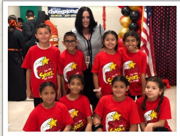
Care Bear Assembly Dance Team