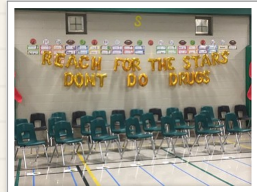
Briscoe Bears Reaching for the Stars!