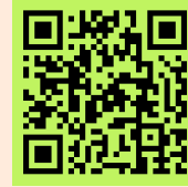
Dojo de clase